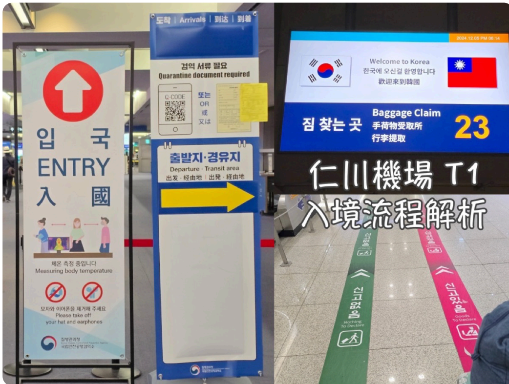
Señales de Llegada en el Aeropuerto de Incheon T1