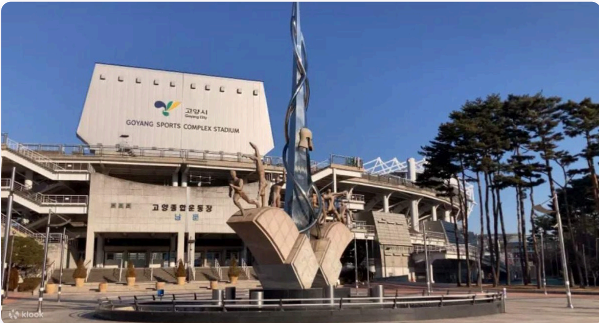
Exterior del Estadio de Goyang