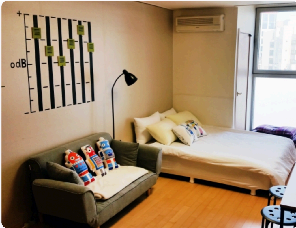
Ejemplo de alojamiento tipo Airbnb en zona Hongdae