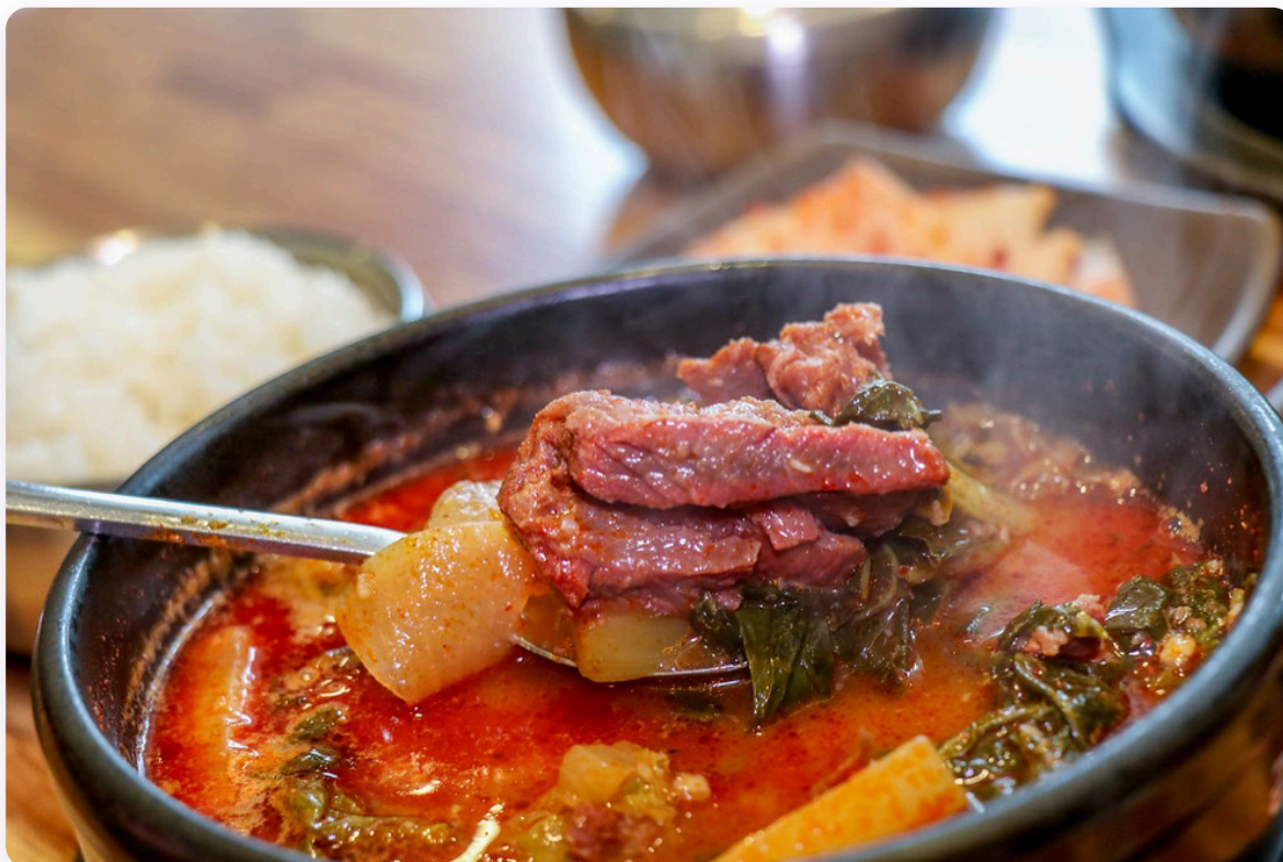
Sopa de ternera coreana - plato tradicional recomendado