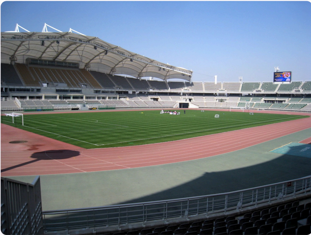
Vista panorámica del Estadio de Goyang