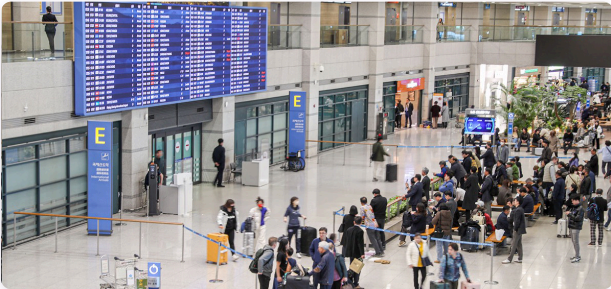
Zona de llegadas del Aeropuerto de Incheon