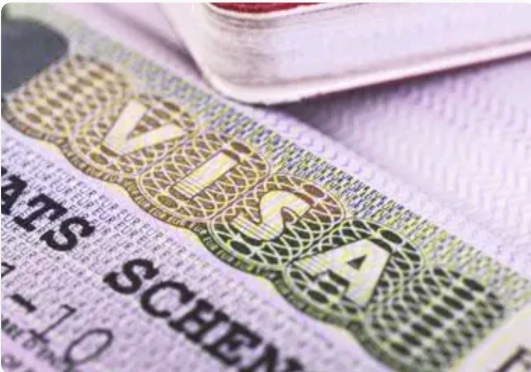
Halimbawa ng Schengen Visa - Karaniwang Kinakailangan

Ang mga patakaran sa visa ng Timog Korea ay malaki ang pagkakaiba depende sa nasyonalidad. Nasa ibaba ang pangkalahatang gabay na naaangkop sa karamihan ng mga bansa, na tutulong sa iyo na mabilis na matukoy kung ano ang kailangan mong ihanda.